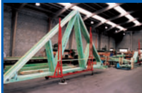
Le bois destiné à la construction doit être livré just in time.