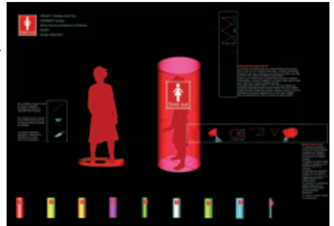
Toilettes Sold Out.