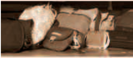
Joséphine Rose distribué en exclusivité chez Veritas.

la vivons au quotidien et exprimons chacun à son niveau quelque chose avec /par elle , c'est pour cela qu'il est toujours important d'observer les consommateurs car ce sont eux qui font la mode à la fin et au début du cycle d'un produit.