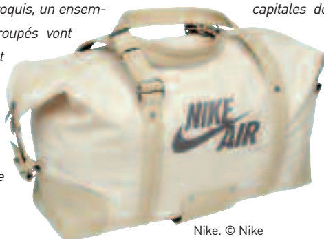
Nike. © Nike

MLS: Depuis le départ, j'ai eu la chance de travailler sur des projets concrets, c'est-à-dire des projets qui passaient le stade du développement pour ensuite passer en production et être distribués et diffusés. Certains designers n'ont pas cette chance et voient rarement leur projet arriver à maturité /à prendre vie, ils restent dans le concept virtuel permanent. Je prends du plaisir à aborder tous les stades du concept de la création au développement du produit à sa mise en place sur le marché (merchandising & marketing). Le tout forme les éléments d'un puzzle qui vont raconter l'histoire d'un produit. Je travaille en général sur base d'un premier 'brief marketing' envoyé par le client qui énonce clairement quels sont les besoins de la marque, le type de produits, la cible du consommateur visé, la composition de la collection (ce 'brief' est discuté avec les équipes de style, marketing & merchandising de la marque soit dans les bureaux au siège du client, soit par conférence call). En tant que designer, j'apporte des réponses créatives à ce brief que je mets au point dans mon studio MLSTUDIO à Bruxelles à l'aide de matières couleurs, échantillons, croquis, un ensemble d'éléments qui regroupés vont faire naître le "concept design" des produits. Ensuite, il y a le dessin de toute la collection modèle par modèle avec toutes les planches de