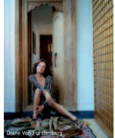
Diane Von Furstenberg

Depuis son quartier général de New York (plus de 14.000 m 2 abritant showroom, bureaux, galerie/théâtre, magasin et dont elle termine ces jours-ci la supervision), Diane Von Furstenberg contrôle la croissance de sa mode. Une discipline vitale pour toute signature. En surveillant la distribution, en ouvrant des boutiques pour mieux gérer mon image, et en proposant des collections mensuelles afin de renouveler les modèles. Toujours soucieuse de glorifier la femme moderne , la créatrice s'attèle à donner à la femme les accessoires et les pièces d'une garde-robe qui la suivent du matin au soir, tant au bureau que pour un dîner en ville ou un cocktail. Un esprit DVF qui pourrait se résumer au côté pratique des Américains (une « wrapdress » se porte du matin au soir) subtilement ponctué de féminité et de détails glamour. Pour preuve, sa réponse à la garde-robe essentielle tient en une petite valise, cette même valise qu'elle imagine chaque mois pour la renouveler d'un manteau, de deux robes (une jour, une plus habillée), un pantalon, un top, et un cardigan