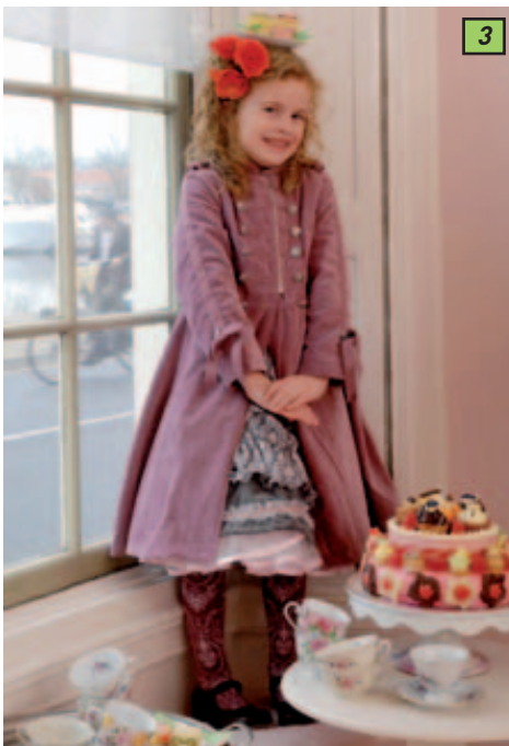
3 Les petites Marie-Antoinette vont se démultiplier durant cet hiver 07-08! © Jottum

Cette marque hollandaise ose imager son langage autour de silhouettes enfantines non dénuées d'originalité et de sources d'inspiration créatives. Les robes, manteaux et jupes exceptionnelles traduisent des époques ou des contrées lointaines. Dans le style de Marie-