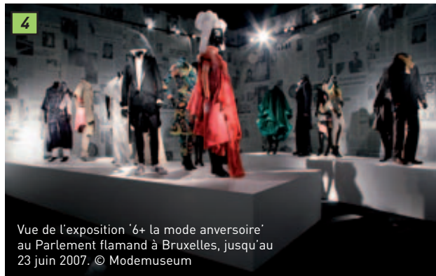
4 Vue de l'exposition '6+ la mode anversoise' au Parlement flamand à Bruxelles, jusqu'au 23 juin 2007.