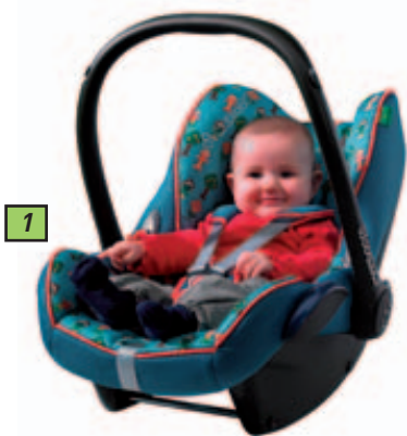
1 Les sièges-autos et poussettes font aussi leur révolution stylistique! Ici, le modèle Maxi-Cosi 'Magic Mosaic'.

À la rédaction, nous disposons de toutes ces informations si vous souhaitez en savoir plus, ainsi que d'une banque d'images actualisée. N'hésitez pas à nous envoyer un email à lise.coirier@skynet.be en libellant très clairement votre question ou votre souhait d'annoncer votre produit dans cette rubrique sous la forme d'une publicoscope.